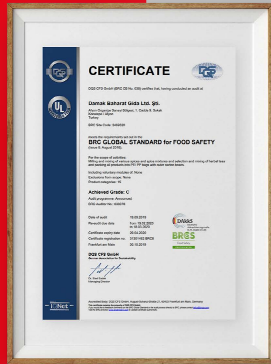
BRC GLOBAL STANDART FOR FOOD SAFETY